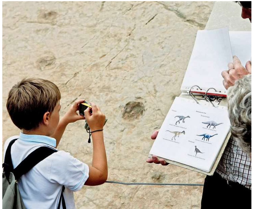
Découvrir les fossiles de dinosaures à 2200 mètres d'altitude dans les Alpes est une activité sportive.

Partir sur les traces des dinosaures, des loups ou des lynx, apprendre à concevoir et piloter son propre drone, découvrir les écosystèmes et étudier leur santé, passer ses nuits la tête dans les étoiles, s'initier à l'architecture écoresponsable ou découvrir les différentes facettes d'une région à travers sa géologie: toutes sortes d'expériences sont proposées aux